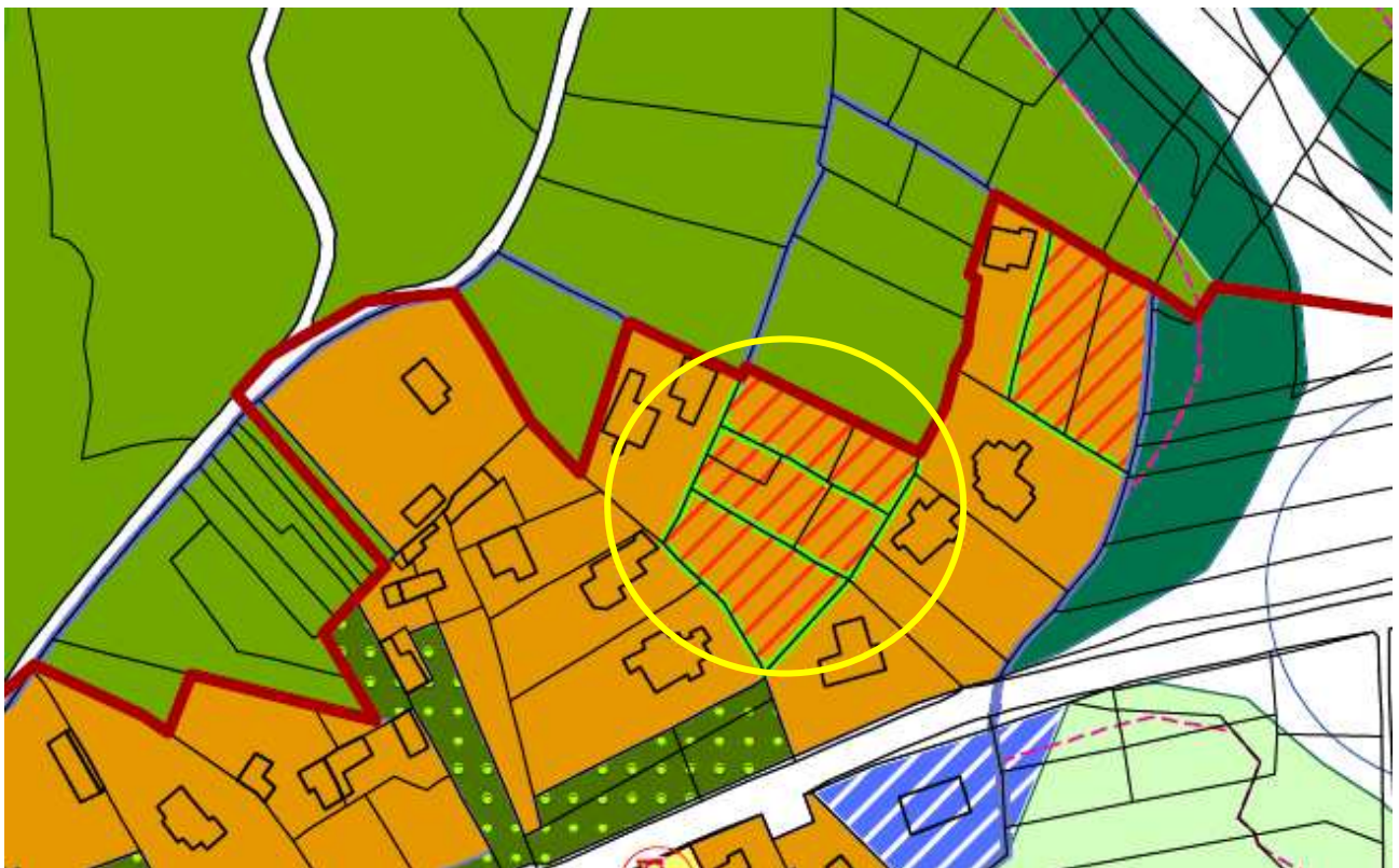
Estratto PRGC tavola n.P1.7 in variante